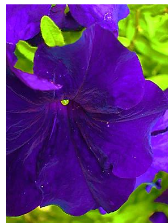
Pétunia août 2008