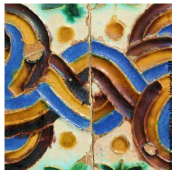
« Carreaux en Espagne » 2019

Le choix de la couleur de l'escalier est remis en cause tous les ans : monochrome géranium rouges -surtout pas roses, car la mode passée en a abusé dans les jardinières, les fenêtres et les balcons ; ou bicolore : pétunia bleus et géranium rouges alternés ; d'autres variantes sont tombées dans l'oubli. Mis à part une racine commune ( le pétun des tupi-guaranis), tabac et pétunia n'ont aucune ressemblance, et surtout pas ce bleu mouvant à la tombée du jour. Mais il y a une certaine magie à descendre au jardin entre deux rangées de tabac bleu.